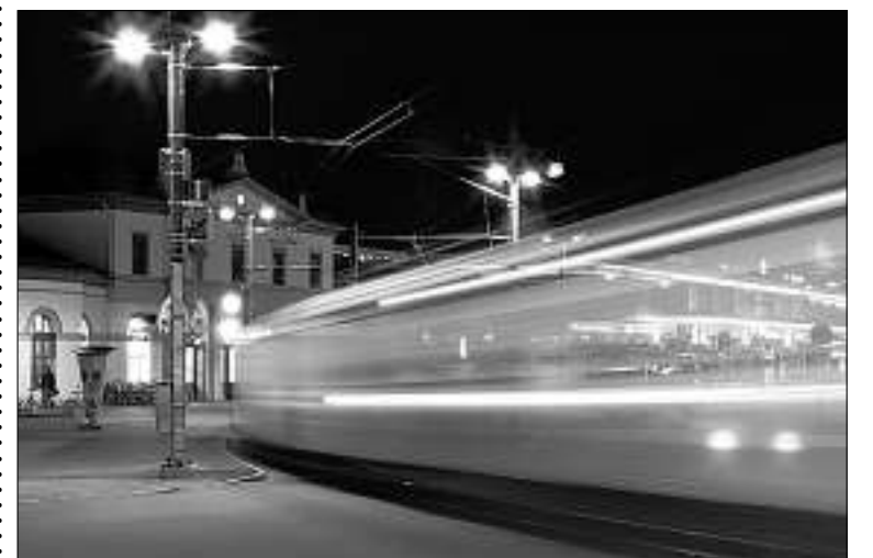
Churer Bahnhof in der Nacht: die Arbeit von Edgar Schnüringer aus Rothenthurm SZ.

Bis 19. Juni. Montag bis Freitag, 14 bis 17 Uhr.